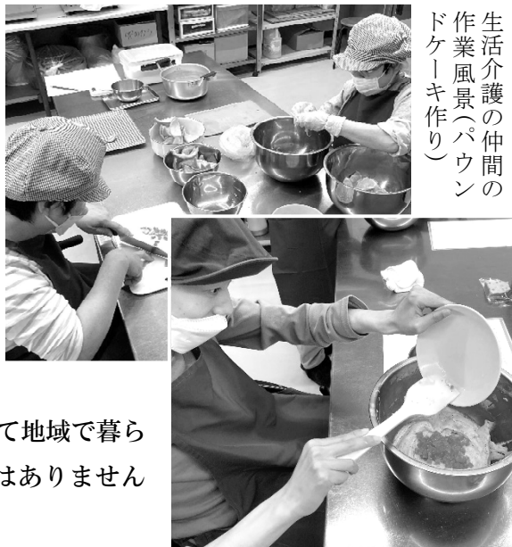
生活介護の仲間の作業風景（パウンドケーキ作り）

「障害のある仲間たちが主人公であること」「権利の主体者として地域で暮らすこと」に協力することに惜しみない力を注いでいくことに迷いはありませんが・・・R7年度も苦難の年になりそうです。